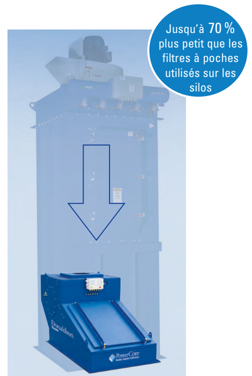
Dépoussiéreur PowerCore® CPV