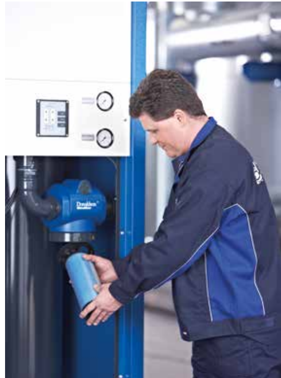
La carcasa del filtro Ultra-Filter es fácil de abrir para cambiar el elemento filtrante.

Donaldson ofrece servicio para todos los componentes de su sistema de aire comprimido- la mejor selección de servicios individuales o completos. Distintas ofertas de mantenimiento adaptadas a sus necesidades y requerimientos.