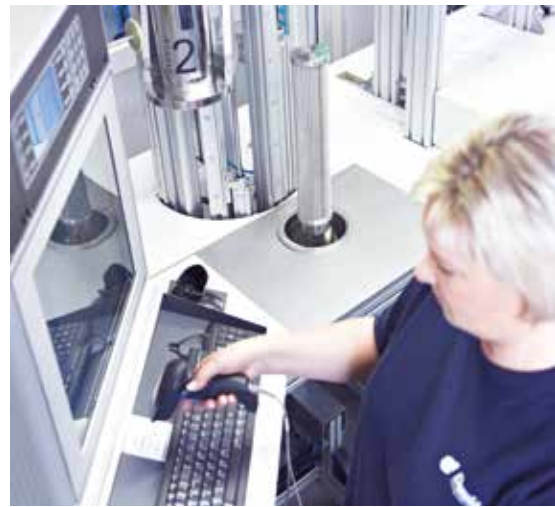
Donaldson ofrece una amplia gama de servicios

Para mejorar y complementar nuestros servicios, disponemos de un laboratorio, altamente sofisticado, para la medición, según ISO8573-2 y ISO8573-3, del contenido residual de aerosoles y vapores de aceite.