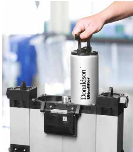
Cambio limpio y fácil de los cartuchos