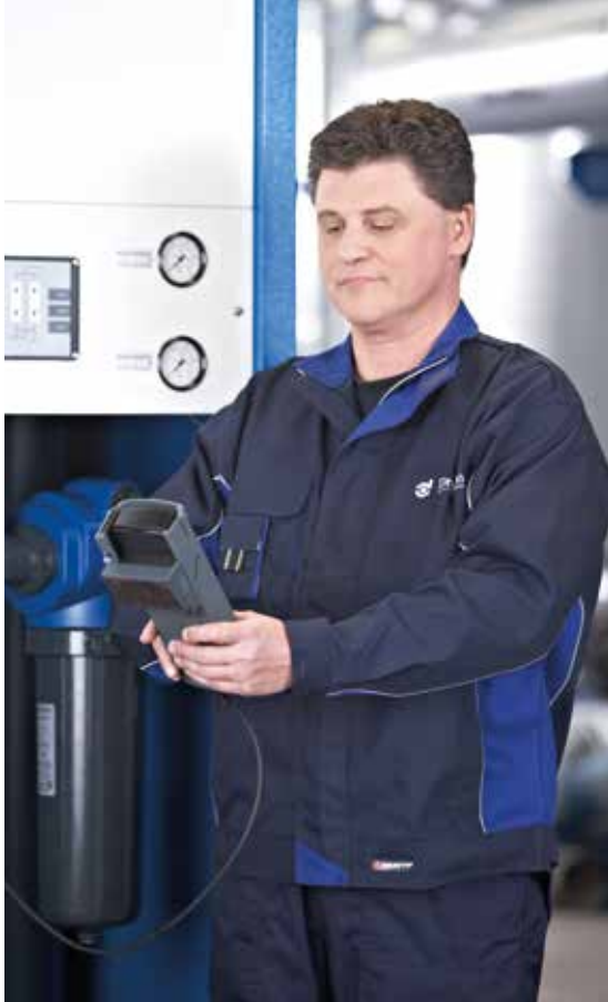
Servicio de filtración total para aire comprimido