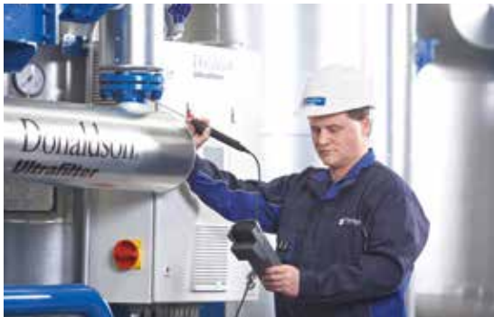
El mantenimiento preventivo evita las llamadas de emergencia

Las tecnologías de medición de Donaldson determinan de manera fiable la calidad del aire comprimido. Se analiza, el punto de rocío, contenido residual de aceite y la concentración y tamaño de partículas. La auditoría de la calidad de aire detecta y determina con precisión los niveles de oxígeno, dióxido de carbono y monóxido de carbono, mediciones imprescindibles en las aplicaciones de aire respirable.