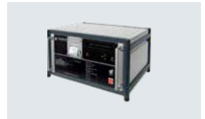
Filter Test Center (FTC)