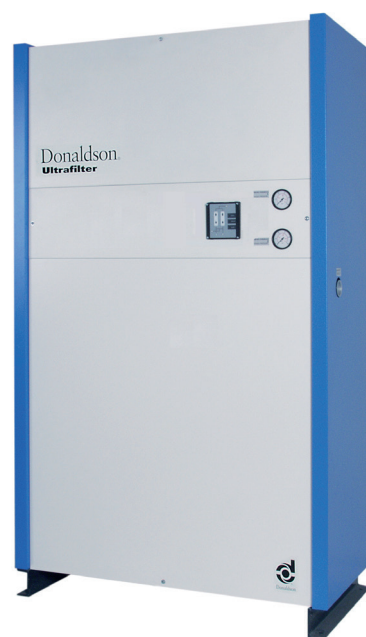
ALG 80 S - 375 S